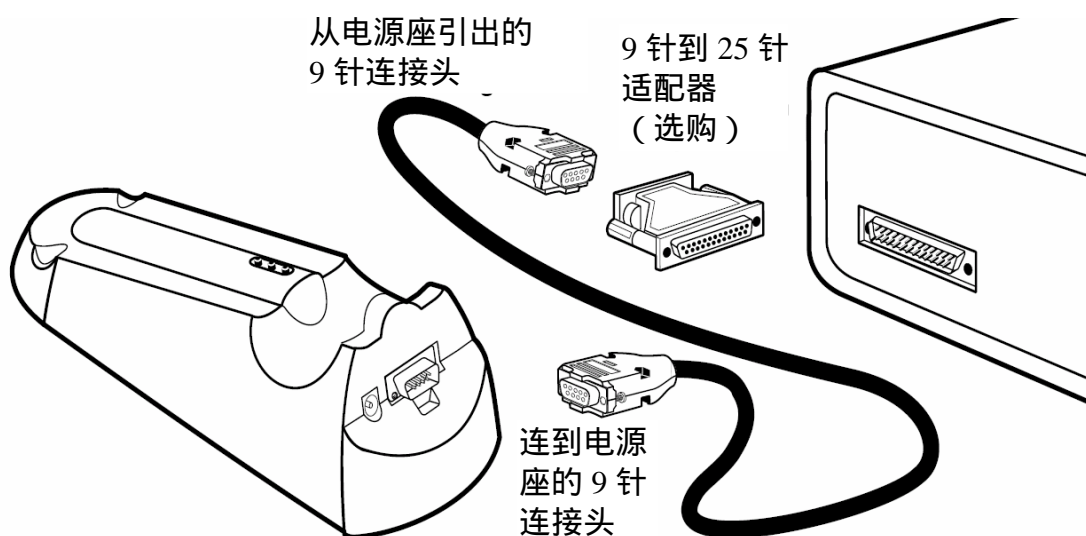
图 8 RS232 缆线连接