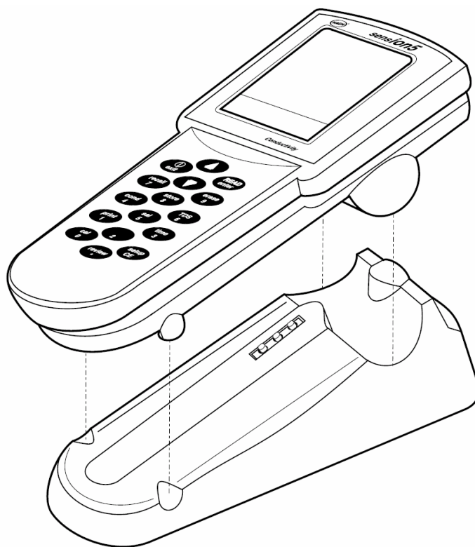
图 4 使用 sensIon 电源座